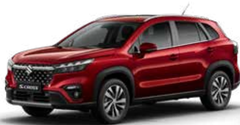
Energetic Red Pearl (ZQ5) Optie op Comfort, Select en Style