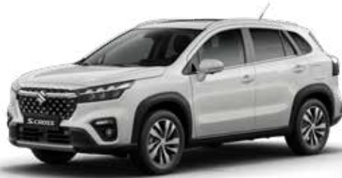
White (26U) Standaard op Comfort, Select en Style

De kleur van een auto is heel persoonlijk. Daarom is de Suzuki S-Cross leverbaar in 8 verschillende kleuren. Vind je het lastig om een goede kleur te kiezen? Kom dan langs in de showroom om de kleuren eens in het echt te bekijken, voordat je een beslissing neemt.