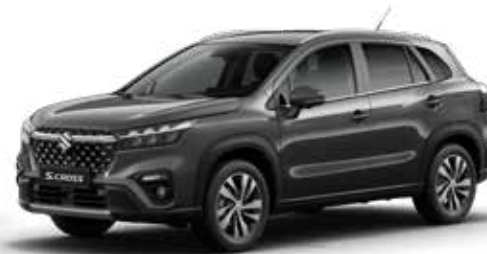
Titan Dark Gray Pearl Metallic (ZZZ) Optie op Comfort, Select en Style

Kleuren kunnen onder invloed van het drukproces afwijken van de werkelijkheid.