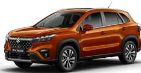
Canyon Brown Pearl (ZQ3) Optie op Comfort, Select en Style