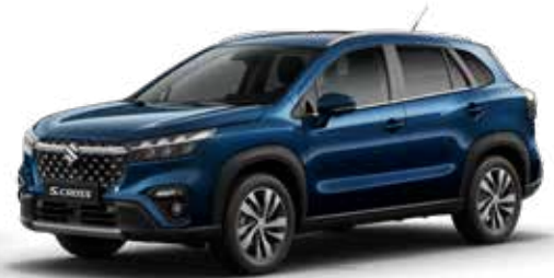
Sphere Blue Pearl (ZQ4) Optie op Comfort, Select en Style