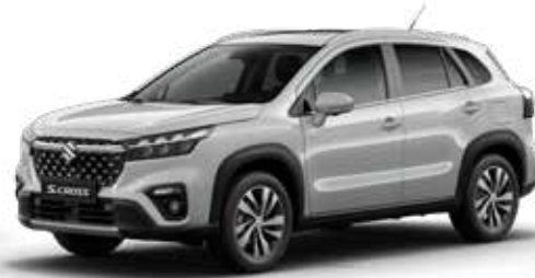
Silky Silver Metallic (ZCC) Optie op Comfort, Select en Style