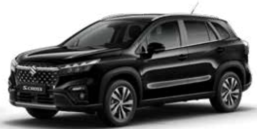
Cosmic Black Pearl Metallic (ZCE) Optie op Comfort, Select en Style