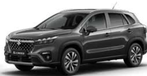
Titan Dark Gray Pearl Metallic (ZZZ) Optie op Comfort, Select en Style

Kleuren kunnen onder invloed van het drukproces afwijken van de werkelijkheid.