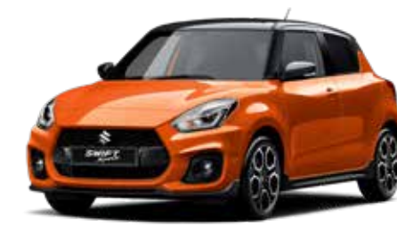
Flame Orange Pearl Metallic & Super Black Pearl