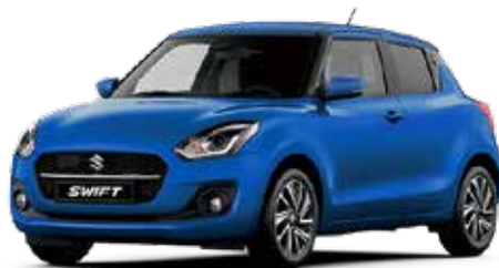
Speedy Blue Metallic

De Suzuki Swift is leverbaar in verschillende kleuren, waaronder een aantal two-tone kleuren. Vind je het lastig om een goede kleur te kiezen? Kom dan langs in de showroom om de kleuren eens in het echt te bekijken, voordat je een beslissing neemt.