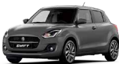
Mineral Gray Metallic