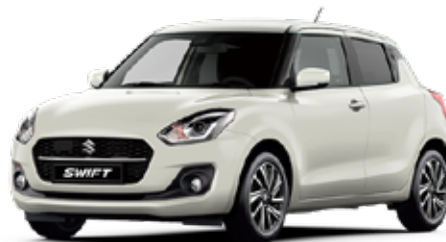
Pure White Pearl