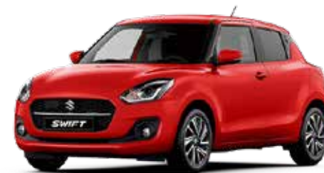
Burning Red Pearl Metallic