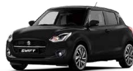
Super Black Pearl