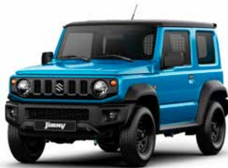
Brisk Blue Metallic & Blueish Black Pearl (CZW)**