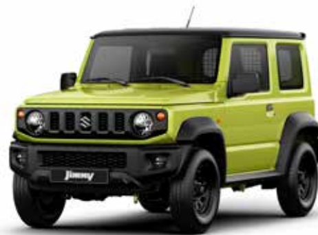
Kinetic Yellow & Blueish Black Pearl (DG5)**