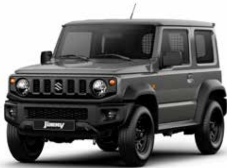
Medium Gray (ZVL)