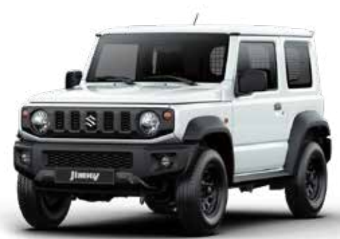
Pure White Pearl (ZVR)