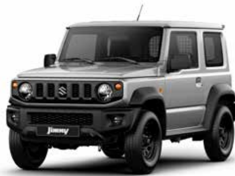
Silky Silver Metallic (Z2S)