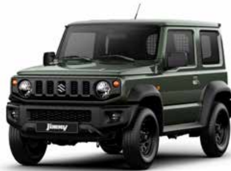
Jungle Green (Z2C)