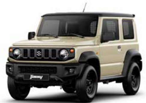
Chiffon Ivory Metallic & Blueish Black Pearl (2BW)**

* Standaardkleur. Alle andere (pearl) metallic-kleuren: optie tegen meerprijs. ** Dak uitgevoerd in Blueish Black Pearl.