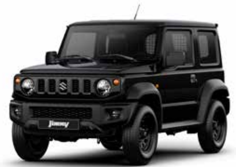
Blueish Black Pearl (ZJ3)