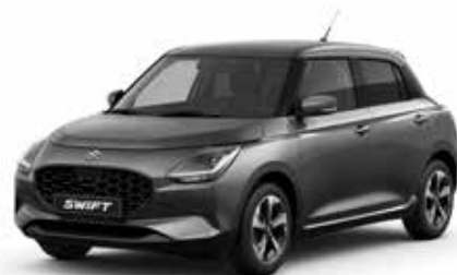
Mineral Gray Metallic