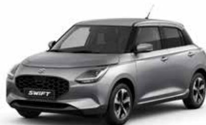
Premium Silver Metallic