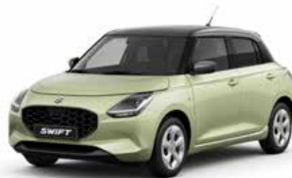
Cool Yellow Metallic & Mineral Gray Metallic***