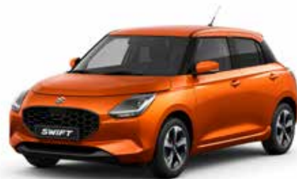
Flame Orange Pearl Metallic

De Suzuki Swift is leverbaar in verschillende kleuren, waaronder een aantal two-tone kleuren. Vind je het lastig om een goede kleur te kiezen? Kom dan langs in de showroom om de kleuren eens in het echt te bekijken, voordat je een beslissing neemt.