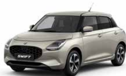
Caravan Ivory Pearl Metallic