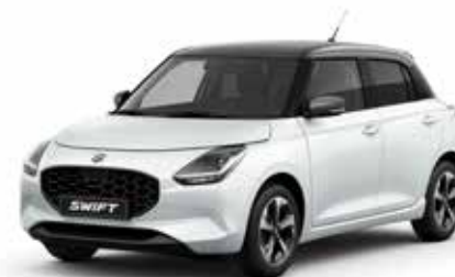
Pure White Pearl & Mineral Gray Metallic***