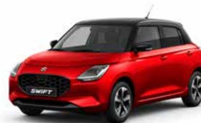
Burning Red Pearl Metallic & Super Black Pearl**