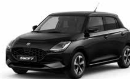
Super Black Pearl