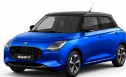
Frontier Blue Pearl Metallic & Super Black Pearl**