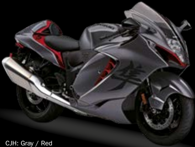
CJH: Gray / Red