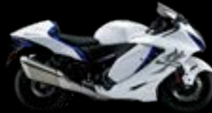
JWN: Blue / White