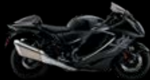
KGL: Black / Black